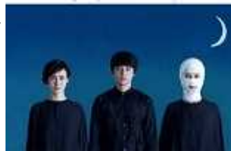
「夜想曲集」は天王州銀河劇場

*3月7日（前編）4月11日（後編）より公開されている映画「ソロモンの偽証」、5月11~24日までの舞台「夜想曲集」に出演の役者さん達のコンディショニングコーチをしました〜。 ☆お時間ありましたら是非ご覧くださ〜い☆